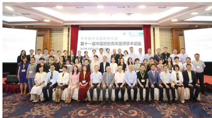
中华医学会放射学分会青年委员会全体委员合影

放射青年医师英文病例读片大赛和英文微课大赛为本届学术论坛注入了活力与朝气，是学术论坛的重大亮点。参赛选手全身心投入，满怀信心地展现才能与智慧；专家评委的点评深入浅出、妙语连珠。这些无一不体现出我们放射青年医师扎实的基本功与出色的英语表达能力。