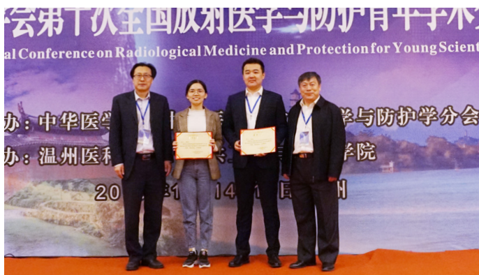
分会领导与论文评选优秀选手合影