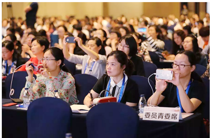
青年医师认真聆听