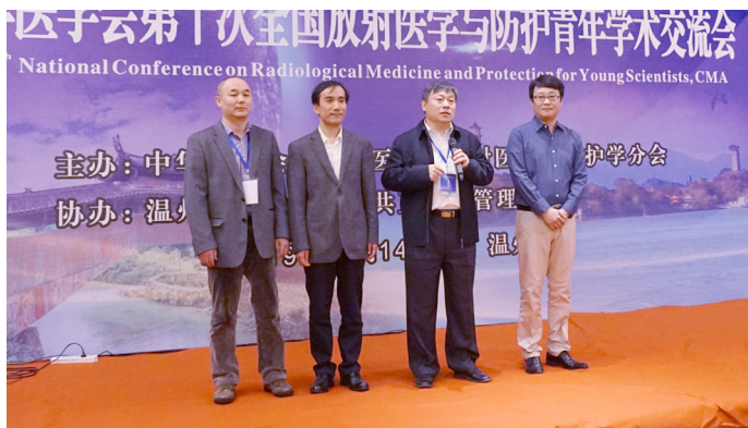
新当选的青年委员会领导合影