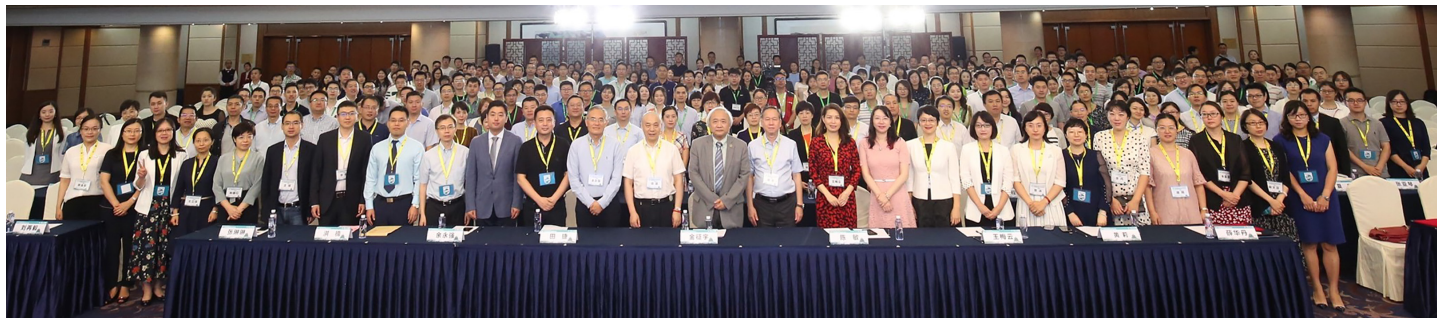
第十一届中国放射青年医师学术论坛开幕式

——第十一届中国放射青年医师学术论坛暨2019年中华医学会放射学分会青年委员会年会在北京召开