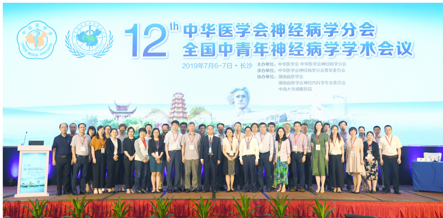
中华医学会神经病学分会青年委员会成员合影

2019年7月6—7日，由中华医学会、中华医学会神经病学分会主办，中华医学会神经病学分会青年委员会承办，湖南省医学会、湖南省医学会神经内科学专业委员会、中南大学湘雅医院协办的中华医学会神经病学分会第十二届全国中青年神经病学学术会议在湖南省长沙市召开。全国300余位专家、学者齐聚一堂，共论神经病学临床与基础研究领域的最新进展，并就热点问题进行讨论。